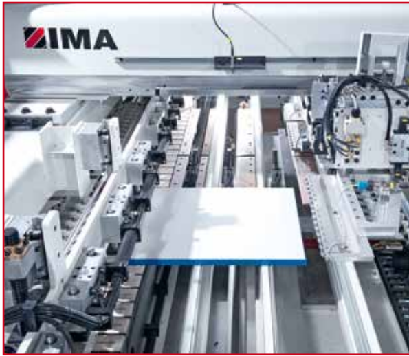
Alimentación de piezas automática y perpendicular Entrada de pieza con tope de ancho