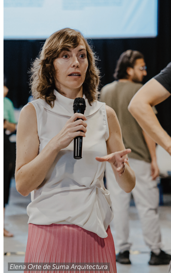
Elena Orte de Suma Arquitectura