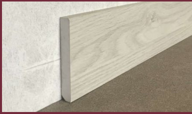
Rodapié antihumedad PVC 90x12mm Largo: 2,25m lineales