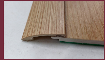
Perfil suelo multinivel 4mm a 8mm adhesivo en PVC Largo: 2,5m lineales