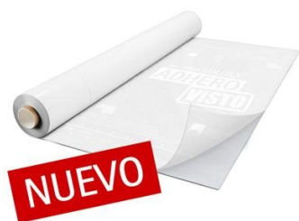
Lámina de hermeticidad y protección autoadhesiva transparente